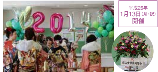
平成26年 1月13日(月・祝) 開催

毎年恒例となった、栢山女学園山添キャンパスで行われる「成人の会」。今年も、1月9日の成人の日に、晴れやかに開催されました。今回は、意外と知られていないこの成人の会について、発足当時の実行委員の皆様と、今年の幹事の皆様にお話をうかがいました。 「現在、成人の会は、高校時の生徒会執行部が行うしきたりで、先輩の代の手伝いをして会の存在を知ったので、有志のメンバーが立ち上げたイベントだとは知りませんでした。栢山で成人の会が開かれることは、中高とも栢山出身で地元成人式に出づらいうちもよく、久しぶりに友達にも会える、良い機会だと思えます」と話してくれました。また企画方法については、「先輩からの引継ぎノートがあります。それでもやはり、卒業生の人数が多く地方にも散らばっているため、準備は大変でした。幹事同士予定を合わせることも苦労しました」とのこと。 そこで、成人の会の企画が負担ではなかったか尋ねると、「生2年度の行事なので、良い会にしたいと思えました。久しぶりに生徒会メンバーで仕事をできて楽しかったです。成人の会をやつて良かったです」と笑顔で会を振り返っていました。 先輩方から、これから成人を迎える後輩たちへ 「成人という節目は人生で度きりのもので、それぞれの道に進んだ友人との情報交換の場ともなるので、これからも心に残る会を続けてもらえたら嬉しいです。」 「成人の会を、このような恒例イベントにしたいなことをとても嬉しく思います。これまで成人の会を開催するにあたり、お力添えをいただいた大勢の方々に心より感謝申し上げます。後輩たちにも、この感謝の気持ちを忘れずに、これからも会を続けてほしいと思います。」