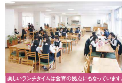
楽しいランチタイムは食育の拠点にもなっています。

2006年の改築の際にランチルーム「s i e a t」ができました。命名は「s i e a t」(スマート)と合わせた生徒によるもの。旧校舎の正面玄関にあったスタンドグラスも西側に張られています。 在校生以外にも、幼児園の保護者の方々の送迎待ち利用や、また同窓生のクラス会などに使用もできます。 席数196席。