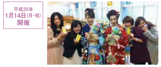
平成25年 1月14日(月・祝) 開催