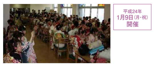
平成24年 1月9日(月・祝) 開催

今年で11回目を迎えた栢山での成人の会は、毎年、有志の会として開かれています。今から10年前の2007年1月8日(月)成人の日、山添キャンパスのランチルームで栢高平成16年度卒業生による、はじめての成人を祝う会が行われました。 発足時の実行委員は、高校3年時にクラス委員で、学園創立100周年記念のモザイク画を製作したメンバーでもありました。当時なにかの機会に集まった際、成人式の話になり、「地元では式典に参加しづらい」「栢山小学校には振袖姿で訪問する行事があるので高校にも行きたい」「高校卒業後会えていない同級生に久しぶりに会いたい」等の意見が出たことで、「今までなかったのなら自分たちの手で...!」と企画したそうです。 今も継続され、毎年高中同窓会から記念品を出していただいていることを知り、「すごい!11回もやってくれる?!感動!成人式懐かしいな。栢山での成人式は私たちがやらなきゃダメ。それを後輩たちが自主的に続けてくれるのが嬉しい」「自分たちの為にやっただけに共感してもらえて、いまだに続いているなんて嬉しいね」と、驚きと喜びの声。発足当時は、先生方のお祝い言葉、懐かしいビデオ鑑賞、集合写真撮影と、シブシブな内容でしたが、とても楽しい時間たちと懐かしそうに話してくれました。 参加者50名程度を予定して、実行委員7名で立ち上げた会は、先生と卒業生の総勢251名が参加する大規模な会になり、晴れ着姿の先輩たちは、きつと中学校・高校のキャンパス内で、後輩たちの目に留まったのではないのでしょうか。