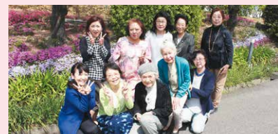
4月18日の会報委員会にて

前回、希望(のぞみ)読者にアンケートをとってみたところ、要望が多かったのは「現在の梶山女学園がどうなっているのを知りたい」というご意見。そこで今回の特集にしたのですが、素晴らしい情報が膨大すぎて紙面が足りないよぉ〜!よしっ、特集ページを1ページ増やしちゃえ!…となりました。時代と共に発展し続ける学園ですが、人づくりこそが教育の礎であるという思いは昔も今も変わりませんね〜。