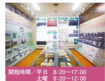
開館時間 / 平日 8:20~17:00 土曜 8:20~12:00

2015年5月、メモリアルルームがあった場所に、栢山歴史文化館の4番目の展示室となる山添展示室がオープンしました。 学園の歴史とあわせ、山添キャンパス、小中、高の教育活動の歴史、また地域歴史の中における学園の歴史を学べる展示室になっています。 設置のタブレットでは、所蔵品やコレクション、また「糸菊」のデータを見ることがができます。