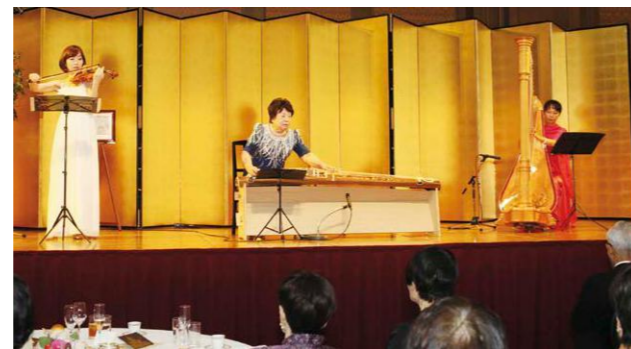
琴、ハーブ、ヴァイオリンのアンサンブル