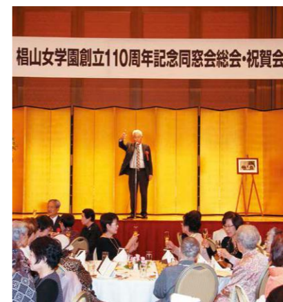
学園長のご発声で乾杯