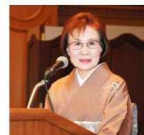
プロフィール 昭和25年 椋山女学園中学校卒。 昭和28年 椋山女学園高等学校卒。 中部日本放送・放送劇団に10年間所属。中部日本放送・ナウンス部に約30年間在籍。 平成2年 椋山女学園創立85周年記念同窓会祝賀会司会担当。 平成27年 椋山女学園創立110周年記念同窓会祝賀会司会担当。

「どの学校？大学？おしゃれだね」という声がかすかに誇らしかったのも忘れたい当時の思い出で、今更ながら、嬉しく有り難い事と感じ入って居ります。