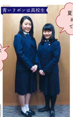
青いリボンは高校生