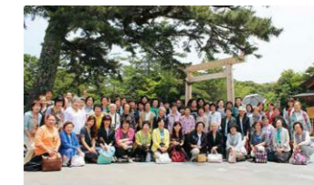
昨年の初夏の小旅行(伊勢にて)

料理旅館(寿屋)にて昼懐石・鯖江市うるしの里・ めがねミュージアム見学会 ●集合時間：8:30 ●集合場所：栄テレビ塔 ●参加費：8,000円(平成27年度年会費納入者 7,000円) ●定員：80名