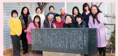
1月7日の会報委員会にて

そもそも同窓会って何?…そんな原点を探るべく、 今号の紙面作りが発売しました。学年は違えど、教室 の同じ窓から同じ景色を眺め、勉学に励みスポーツ にいそしんだあの頃、キラキラ輝く日々は誰もが共有 できる想いですよね。そういえば椋山って女性の園 だと思っていたけれど、昭和29~39年は小学校が 男女共学だったことも再確認!貴重な歴史です。 不思議なご縁で結ばれた同窓の友に乾杯~!