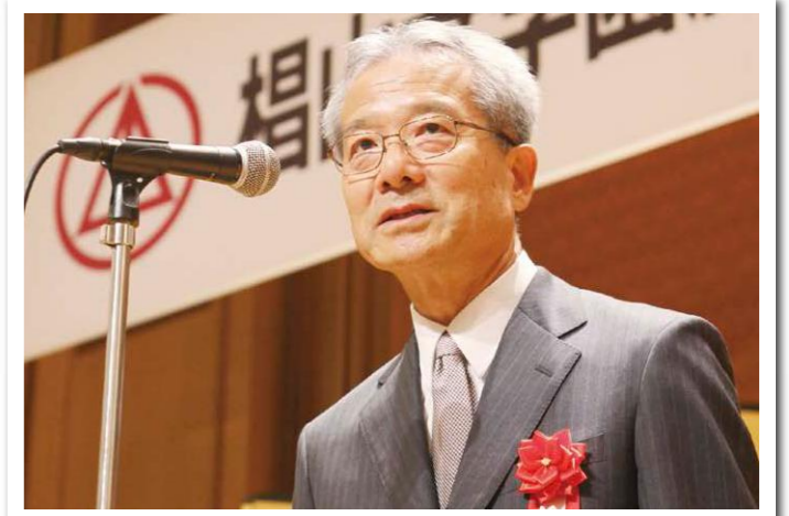
感謝の意を述べる森棟理事長