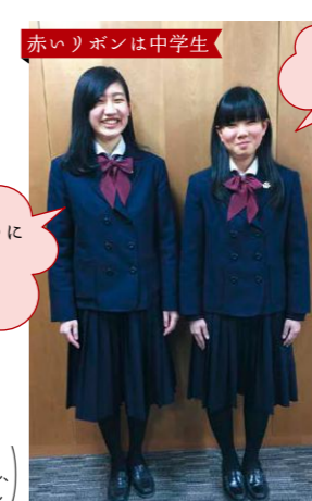
中学生はリボンの色がかわいい