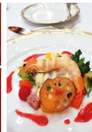
フランス料理に舌鼓