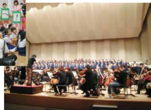
名古屋フィルハーモニー交響楽団とのエールコンサート

ブルキナファソへ梶小で使われていた机とイスを贈る支援交流プロジェクト ※ブルキナファソは、西アフリカに位置する共和制国家。