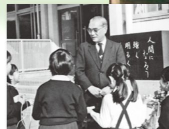
梶山小学校 校訓 【強く 明るく 美しく】碑の前で(1981年)