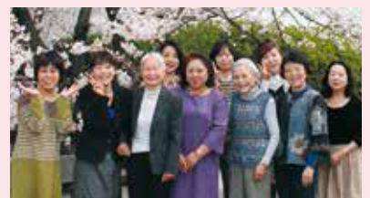
4月2日の会報委員会にて

4号はプチリニューアル。発行日も創立記念日の6月1日になりました。私達も気分を変えて星が丘キャンパスの人間橋の桜の前で記念写真。仕事、子育てや家族の世話、受験生の母も2人いて編集会議では、なかなか全員揃わないけれど『出来る時、出来る人でやりましょう』で、ようやく仕上がりました。少し雰囲気の変った紙面をお楽しみください。