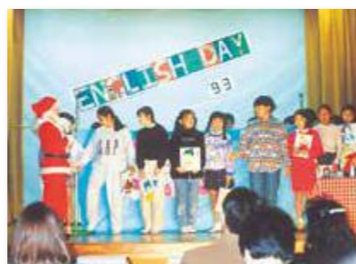
全学年、年に一度の英語学習発表会／ イングリッシュデー(1993年)