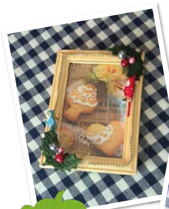
クリスマスケーキの飾りも思い出に。

フレームのベースカラーを変更するなら、端布を両面テープで貼付けたり、お気に入りのマスキングテープを貼るのもおすすめです。