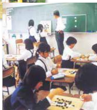
学校完全5日制により開始された 「土曜教室」／囲碁講座 他に三味線、絵画、英語、新体操、 和太鼓、パソコン等(2002年)