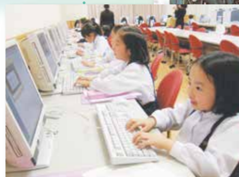
3年生から始まる パソコン教室(1999年)