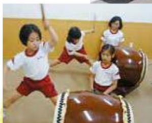
クリプトメリアンセミナー/和太鼓