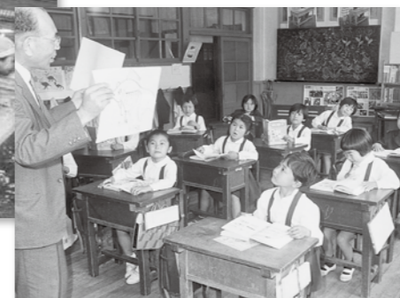
開校以来続いている 1年生からの英語の授業(写真は1967年当時)