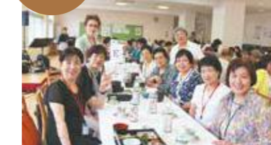
昨年的高中懇親会の様子

懐かしい先生方や 大先輩をお迎えし、 椋山のお話を伺います。 お友達お誘いあわせ のうえ、ご参加ください。 (おみやげ付)