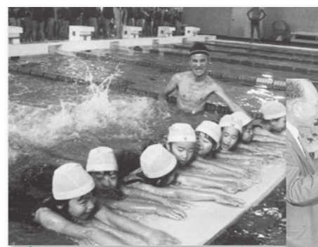
温水プールで初泳ぎ始業式(1982年)