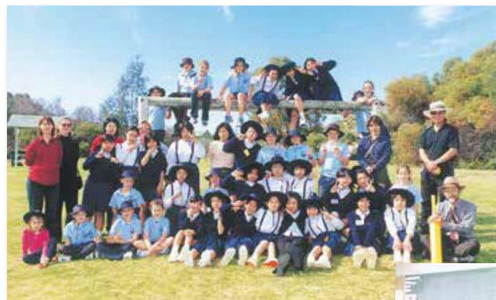
海外交流／オーストラリア・ハースホームステイ グレーラル小学生と一緒に(2002年)