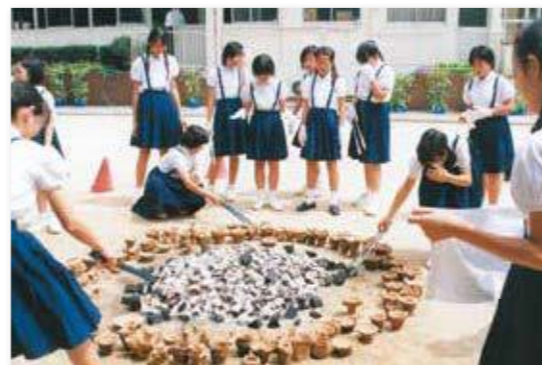
学習意欲を高める社会科体験授業／野焼きの土器作り 他に有松絞り、伊能忠敬の測量方法による地図作りなど (1989年)