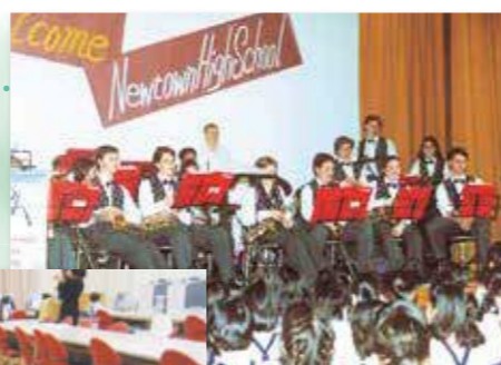
海外交流／ ニュータウンハイスクール 歓迎演奏会 (1996年)