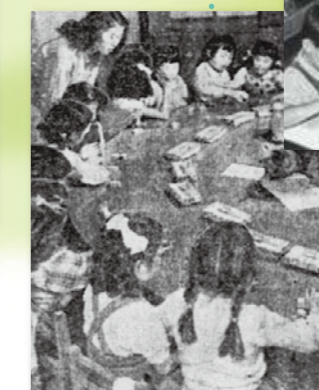
創造性・創作力を発揮させる 個性に応じた教育 (1952年)