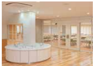
新校舎内/ コミュニケーションスペースの円形手洗い

IT技術を取り入れ、世界とのネットワーク環境も備えた新校舎、学童クラブと多彩な講座のクリプトメリアンセミナーからなるアフタースクールが、新たな学びの場として、伝統を生かしながらも未来志向の学校を創り出すための基盤となっています。