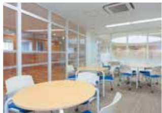
新校舎内/ 広々と開放的なグローバルセンター