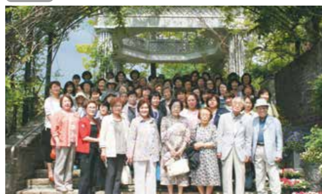
昨年の初夏の小旅行(藝科バラクライングリッシュガーデンにて)