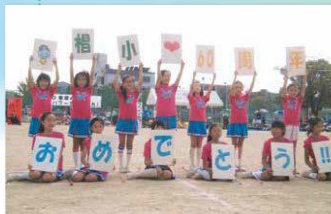
創立60周年記念行事の一つ記念運動会(2012年)