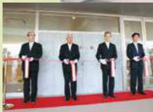
創立60周年記念式典